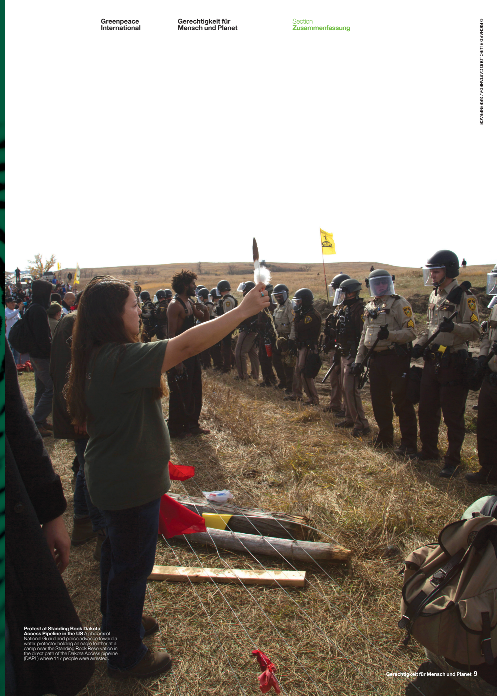
Protest at Standing Rock Dakota Access Pipeline in the US A phalanx of National Guard and police advance toward a water protector holding an eagle feather at a camp near the Standing Rock Reservation in the direct path of the Dakota Access pipeline (DAPL) where 117 people were arrested.